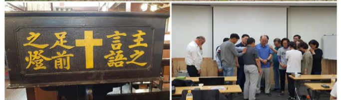
<OCC 공동체와 함께 강화도에서>