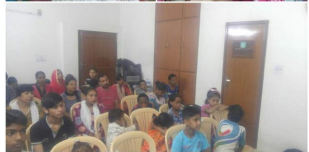
<고빨뿌르 교회 그룹리더, 아이가 태어 났어요^^>