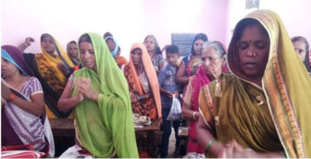
<바라나시지역 가정교회 예배 모습>