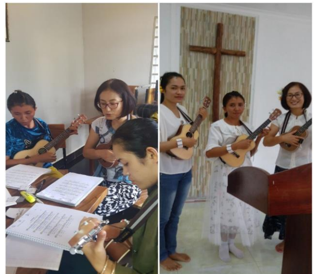
<캄보디아 스텔란 교회 우쿨렐레 강습과 발표>