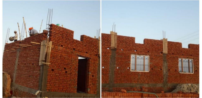
<바라나시 가정교회와 교회건축>