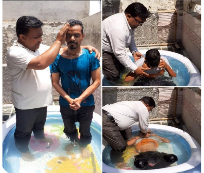
<메라트 가정교회 세례식>