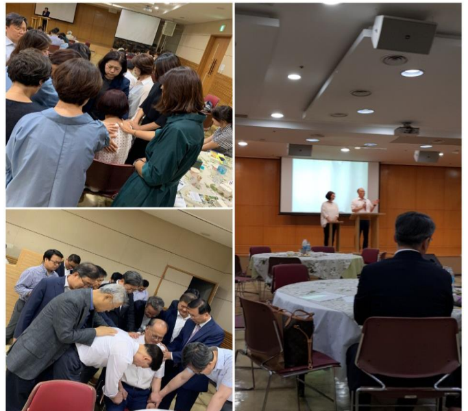
<OCC 공동체 종강 예배에서...>