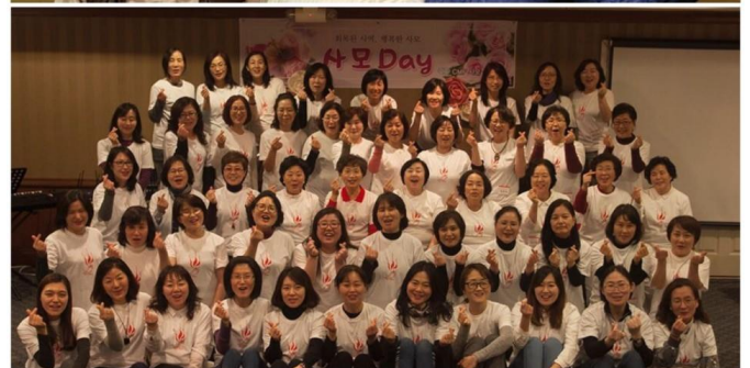
<사모 데이 세미나>